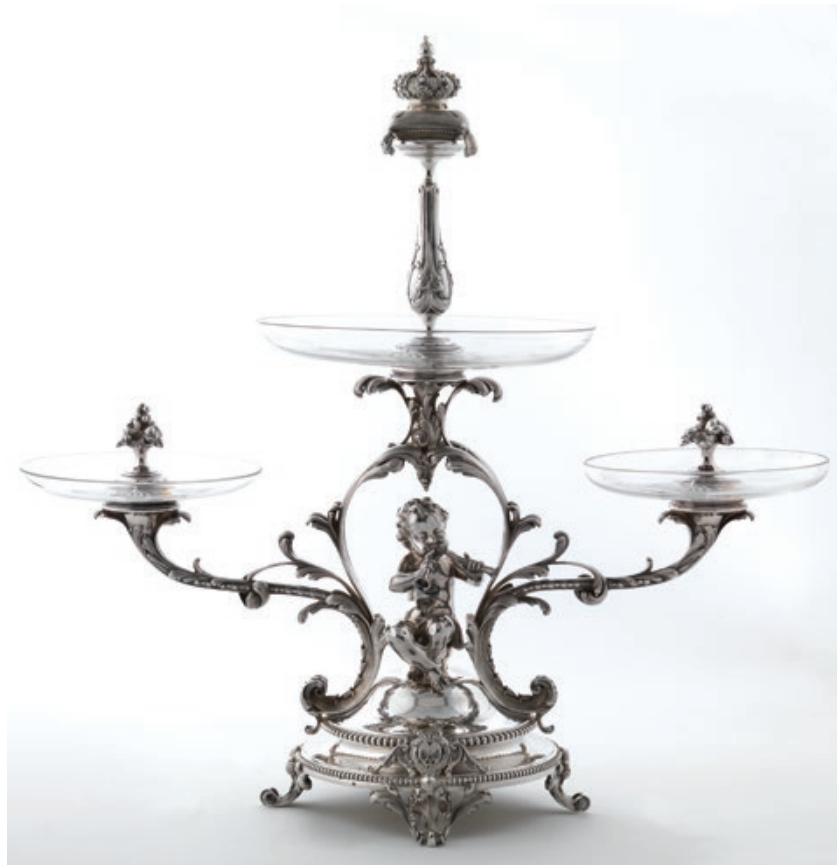
Fig. 08 · Fruteiro triplo ou “prato montado”, Augustin Veyrat; Prata e cristal; 50x53x21,5 cm; PNA, Lisboa

Desde a realização do referido leilão, em 1912, até muito recentemente, o paradeiro deste importante centro de mesa foi uma incógnita. 32 Passados 102 anos, quis o destino que afortunadamente viesse a público ao aparecer para venda no leilão da Cabral Moncada de 15 de Dezembro de 2014. 33