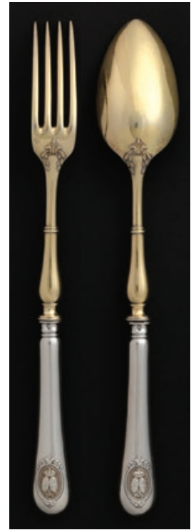
Fig.05. Garfo e colher para salada (reverso), Augustin Veyrat e Thomas & Hénin; Prata e prata dourada; 2,7x25x2,2 cm (Garfo), 2,7x25,6x4,2 cm (Colher); PNA, Lisboa

1 terrina, 2 pratos cobertos legumeiros, 2 pratos com escalfador, 1 travessa grande, 2 travessas médias, 4 pratos grandes, 5 pratos pequenos, 1 molheira, 1 galheteiro, 4 bases para garrafa com prato, 6 taças compoteiras, 2 bases para garrafa transfuradas e 12 coleiras para garrafa [fig.06].