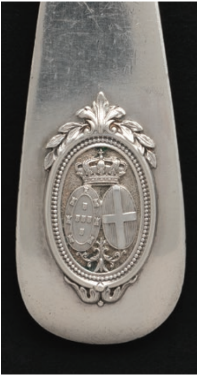
Fig. 03. Armas de aliança de Portugal e Sabóia coroadas no cabo de um talher; Prata; PNA, Lisboa