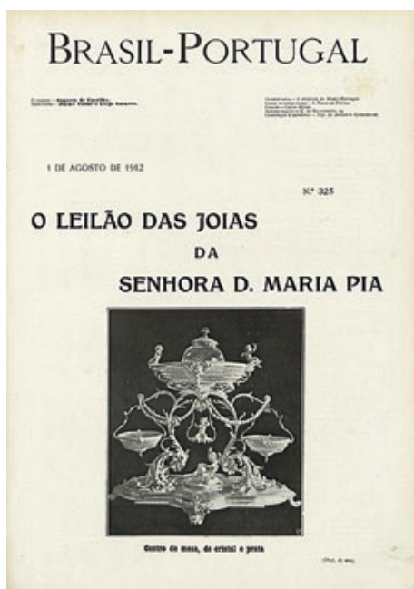
Fig. 09. Capa da revista Brasil-Portugal , 1 de Agosto de 1912