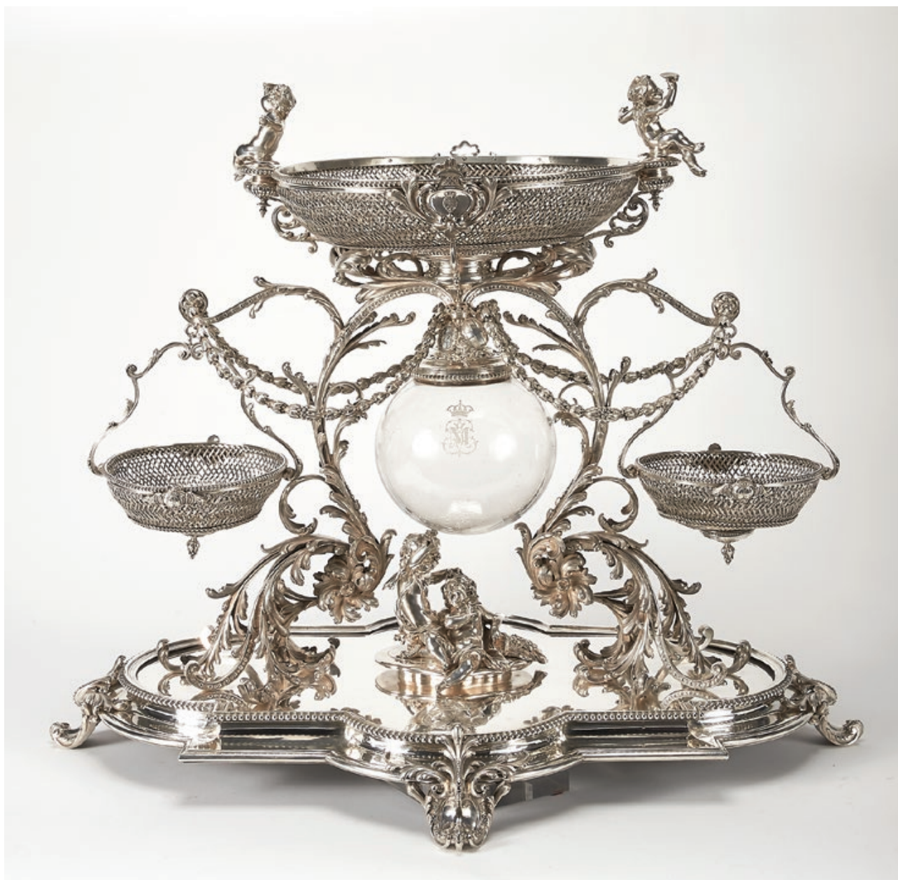
Fig. 12. Centro de mesa com aquário, Augustin Veyrat; Prata; 76x90x64 cm; PNA, Lisboa

Foi o que sucedeu a 9 de Março de 1907 com alguma prata De sua Alteza que se emprestou às Necessidades . De entre uma listagem de variadas peças, sob a designação De sua M[agestade] R[ainha] são mencionadas as “serpentina caçamento 2” e “fructeiros e vidros caçamento 4.” 42 Do mesmo dia é uma outra lista que discrimina o Serviço que foi para Cintra para o chá rei saxe . No verso da lista, sob o elucidativo título Á Luiz 15º , e mais abaixo sob