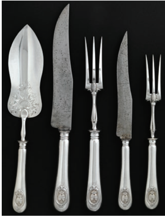
Fig. 04. Pá para peixe, Faca e garfo trinchantes (2), Augustin Veyrat, Thomas & Hénin (respectivamente); Prata, prata e aço; 2,4x29,8x5,4 cm (Pá), 1,8x28,3x2,4 cm (Faca), 2x24,6x2,6 cm (Garfo), 2x17,8x1,9 cm (Faca), 2x13x3,3 cm (Garfo); PNA, Lisboa