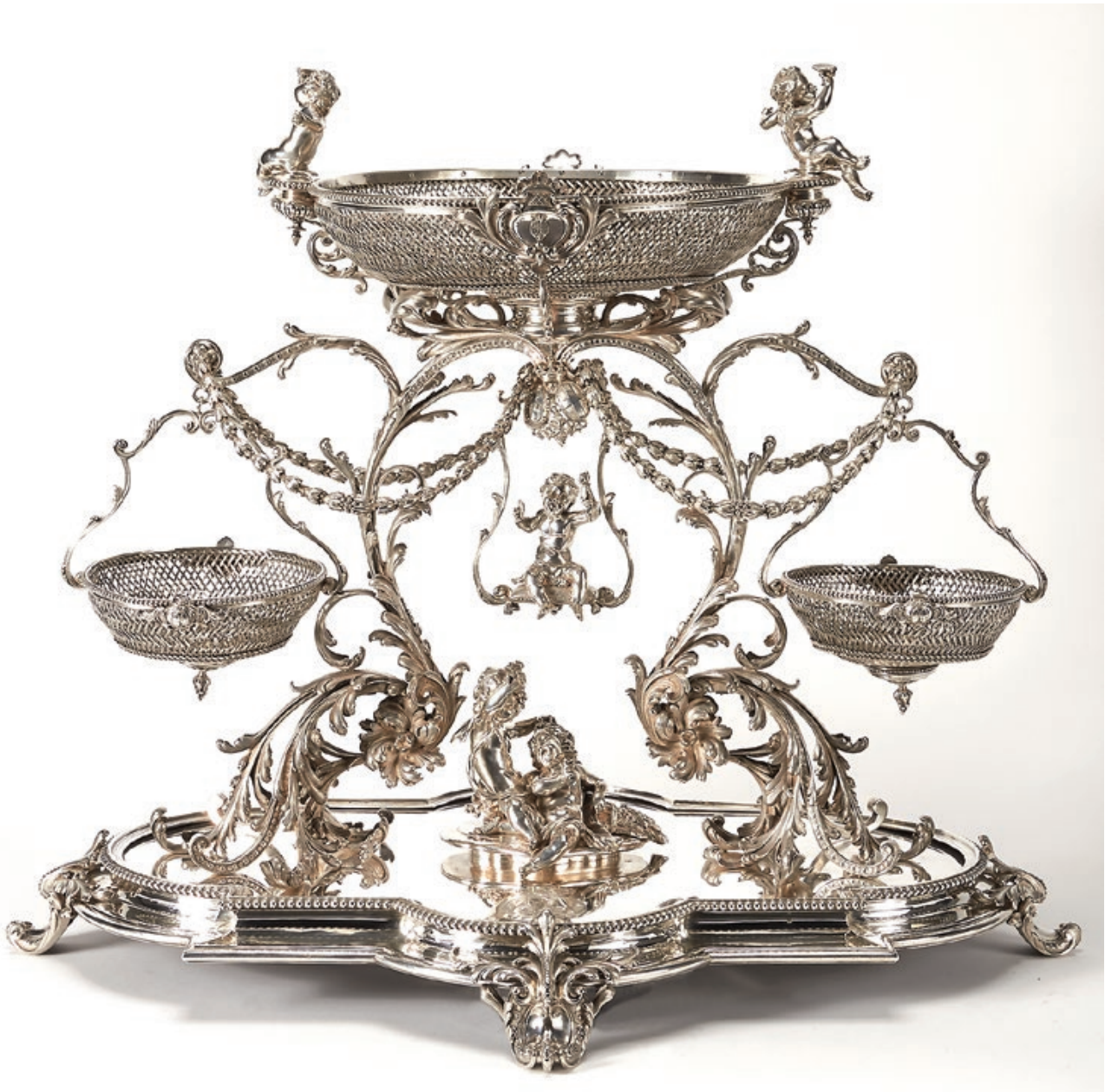
Fig. 11- Centro de mesa, Augustin Veyrat; Prata; 76x90x64 cm; PNA, Lisboa

peixes aro de prata”, “tampa de prata do dito” bem como as duas travessas, encontram-se devidamente assinaladas com a nota manuscrita a lápis “no Banco de Portugal.” 40