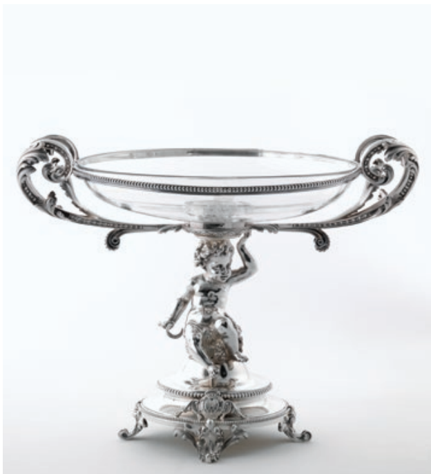
Fig. 01 · Fruteiro grande, Augustin Veyrat; Prata e cristal; 33,5x42,5 cm; PNA, Lisboa