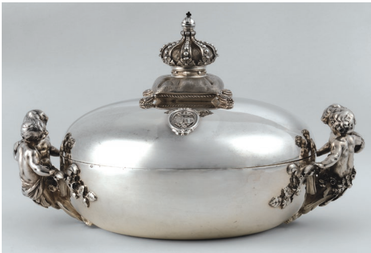
Fig. 06- Prato coberto, Augustin Veyrat; Prata; 16,5x26,5x19,3 cm; PNA, Lisboa

de relevo sobre as peças que então foram vendidas. O leilão integrou 367 lotes de jóias 27 e 8 de pratas, estes no final do catálogo, todos sem uma única fotografia. O centro de mesa e as duas travessas pertencentes à baixela Veyrat são sumariamente referenciados nas duas últimas entradas, n.ºs 7 e 8 nos seguintes termos: “Centro em prata cinzelada acompanhado de fruteiros em prata trançada” e “Duas travessas”, respectivamente. Graças a um exemplar do catálogo acompanhado de detalhadas anotações manuscritas à época, 28 temos conhecimento do nome dos compradores bem como do valor de arrematação das obras. O centro de mesa foi adquirido por Luís Monteiro, pela quantia de 1.300.000 escudos e as travessas por Eduardo John, associadas no mesmo lote