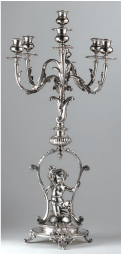
Fig. 07 · Candelabro, Augustin Veyrat; Prata; 71,5x35,5 cm; PNA, Lisboa