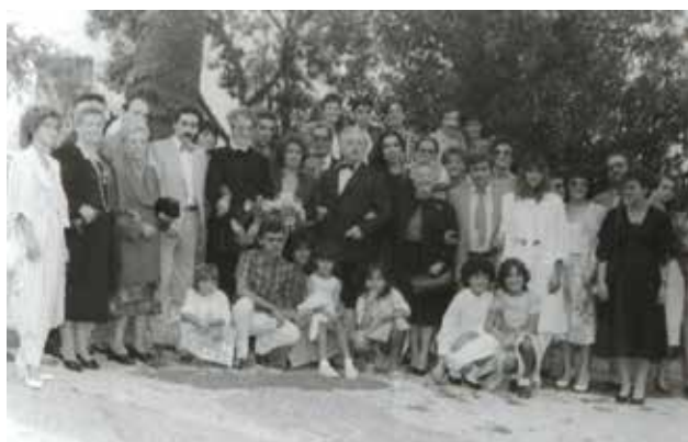
Fig. 04. Fotografia C2E1AT252 em "Atividades extra".