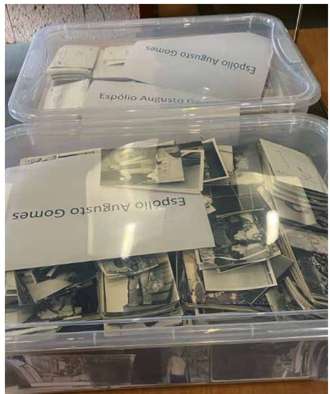
Fig. 33· Estado da coleção no primeiro contacto; Museu Nacional do Teatro e da Dança, Lisboa.