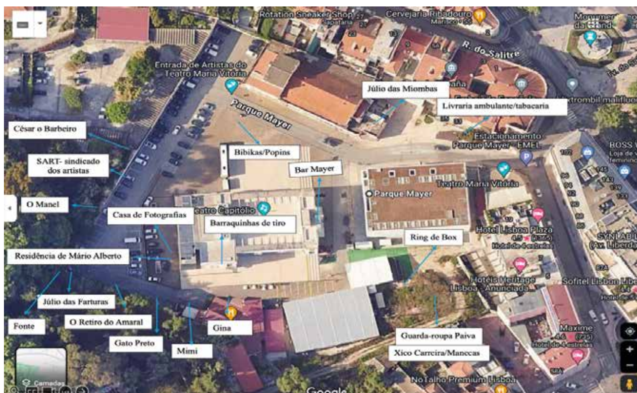
Fig. 34. Mapa do Parque Mayer e os seus antigos estabelecimentos.