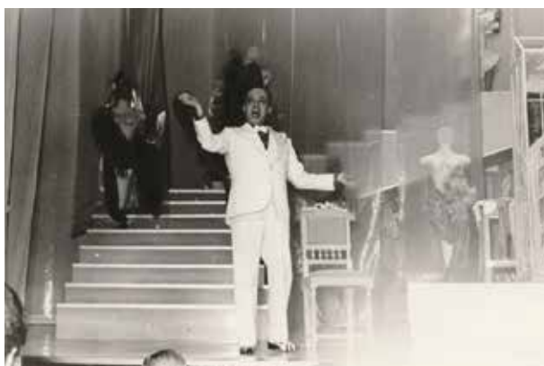
Fig. 20· Fotografia de Raul Solnado em "Palco".