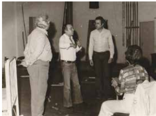
Fig. 14· Fotografia de Raul Solnado em "Ensaios".