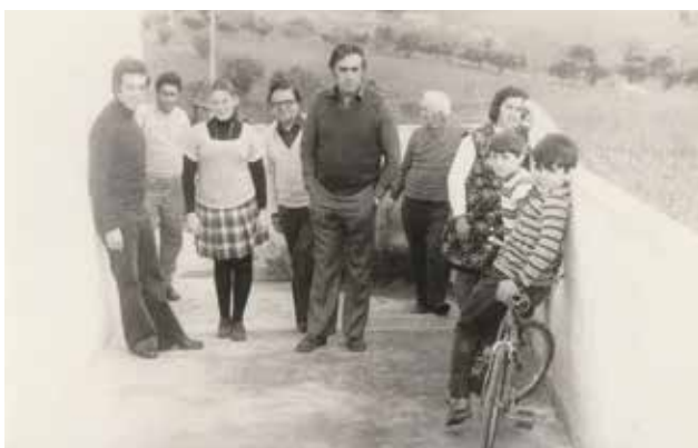
Fig. 03. Fotografia C2E1AT45 em "Atividades extra".