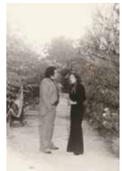
Fig. 32· Fotografia de Nicolau Breyner e Teresa Roby em "Vivências".