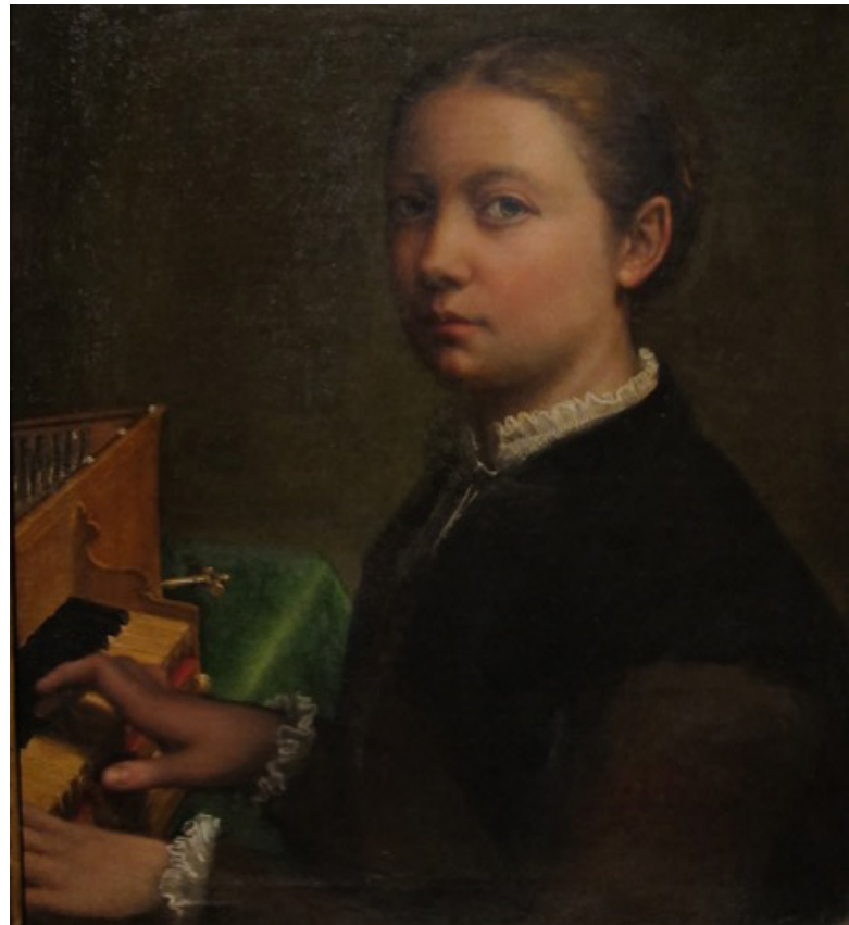
Fig. 01. Auto-retrato tocando espineta , ca. 1556-57, Sofonisba Anguissola; óleo sobre tela; 56,5x48 cm; Museo e Real Bosco di Capodimonte.

Notámos, no entanto, e apesar dos valiosos estudos e dados laboratoriais dados à estampa no catálogo e nas Jornadas homónimas, a ausência de menção à música. Vejamos.