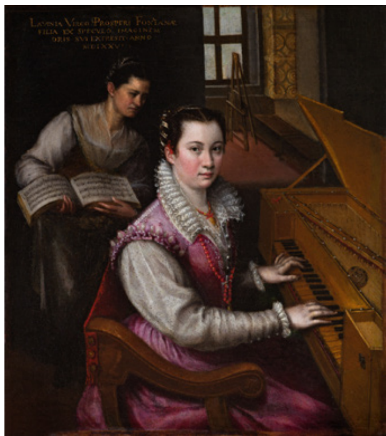
Fig. 02. Auto-retrato tocando espineta , 1577, Lavinia Fontana; óleo sobre tela; 27x23,8 cm; Accademia Nazionale di San Luca.