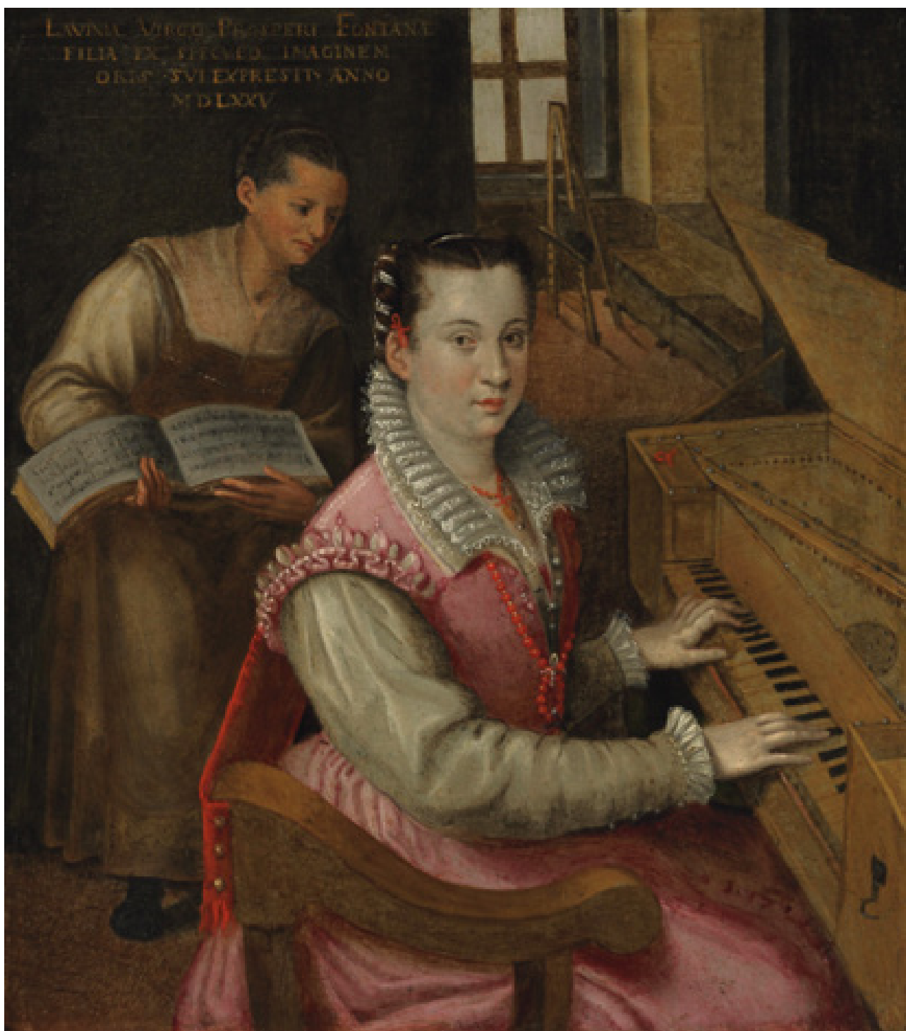
Fig. 05. Lavinia Fontana tangendo espineta, autor desconhecido; óleo sobre cobre; 26x22,8 cm; colecção particular. (fot. cortesia da Christie's, 2013).