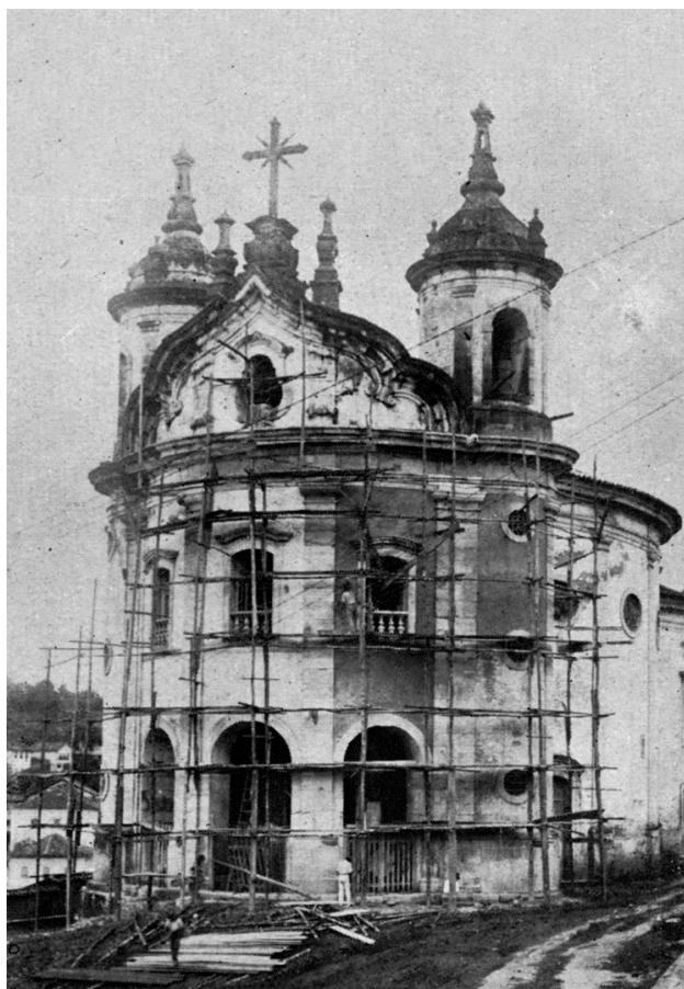
Fig. 05. Igreja do Rosário de Ouro Preto em obras durante a administração de Antônio Carlos, c. 1928.

não podia prescindir do apoio político mineiro. Por outro lado, a característica ímpar de locus da Inconfidência Mineira assegurava a Ouro Preto uma posição de honra no panteão da simbologia nacional,