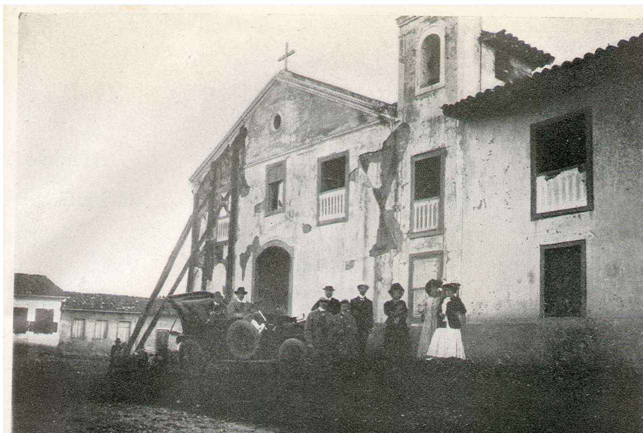
Fig. 08- A Igreja do Embu, antes de ser restaurada pelo SPHAN.

quaisquer afinidades políticas ou culturais — no que tange à inspeção dos monumentos nacionais.