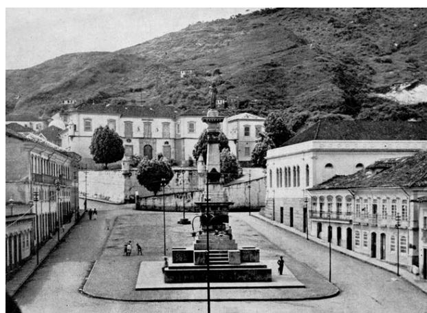
Figs. 06, 07. Aspectos de Ouro Preto no início do século XX. Acima, vista geral da cidade aos pés da Igreja do Carmo; abaixo, a Praça Tiradentes, dominada pelo antigo Palácio dos Governadores (atual Escola de Minas da Universidade Federal de Ouro Preto).

Mais tarde, Rodrigo Melo Franco de Andrade (RMFA), já na qualidade de diretor do SPHAN, algo ingenuamente, referiu-se ao episódio da seguinte forma: “Dissolvido o Congresso Nacional pelo movimento revolucionário de Outubro de 1930, inaugurou-se no Brasil um regime discricionário que poderia ter facilitado a organização conveniente e rápida da proteção ao patrimônio histórico e artístico do país. Entretanto, este não se beneficiou das facilidades que o regime lhe poderia proporcionar para sua proteção senão após 3 anos de vigência daqueles poderes discricionários. Só em 1933, surgiu uma sugestão propícia e foi promulgado o Decreto No. 22.928, de 12 de julho, que constituiu a primeira lei federal sobre a matéria e que, embora de alcance restrito pelo seu objetivo, teve grande significação por haver assinalado a decisão dos poderes públicos nacionais de iniciarem uma política nova” (Andrade, 1952:45-46, grifo nosso).