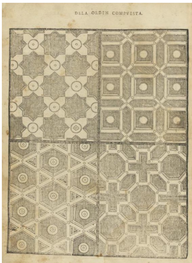
Fig. 01 · Gravura com modelos decorativos para tectos do Tercero y quarto libro de Architectura de Sebastiano Serlio, na edição espanhola de Francisco de Villalpando, publicada em Toledo, em 1552