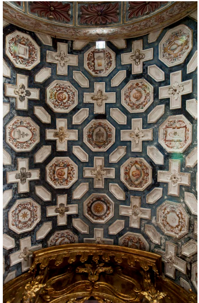
Fig. 02. Évora, Igreja de Nossa Senhora da Graça do Divor, tecto da capela-mor