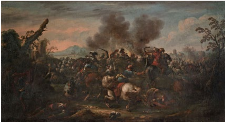
Fig. 1 · Jan Pieter Van Bredael, Batalha entre cristãos e turcos, c. 1725, Inv. 10948.