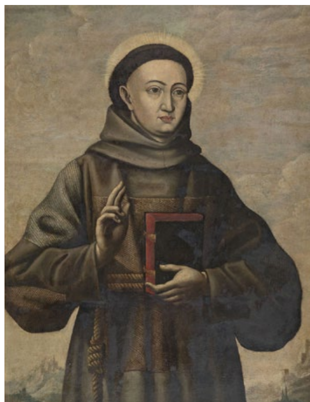
Fig.4 · Autor desc., Santo António, séc. XVIII, Inv.º 10947.